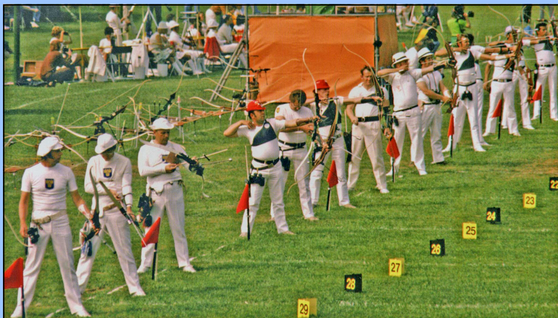
Bueskydningen tilbage igen ved OL. I alt 95 bueskytter fra 24 lande deltog i München 1972.

En beskrivelse af de mange bestræbelser der blev udfoldet for at få genoptaget bueskydningen ved OL - bl.a. fra dansk og svensk side - samt fra den internationale bueskytteorganisation FITA.