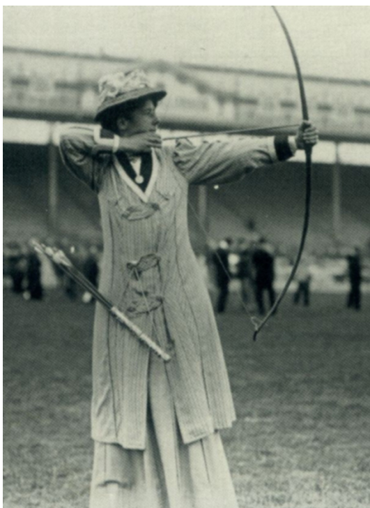
Charlotte Dod, England vandt sølvmedalje i London 1908 i tidens outfitt kunne også spille tennis. Hun blev berømt for fem Wimbeldon-mesterskaber.