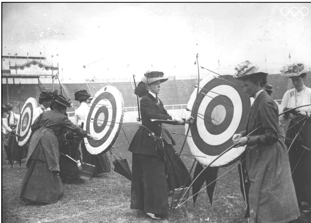
Bueskydning ved OL Sct. Louis 1904 - Women's double Columbia round. De damer medbringer buerne ved markering, idet man skød begge veje...

D e såkaldte "moderne" Olympiske Lege startede med legene i Athen år 1896. Der var ni sportsgrene på programmet, og bueskydning var ikke en af dem. Først ved næste OL i Paris år 1900 blev bueskydning en del af den olympiske bevægelse. Det var lang tid før det internationale bueskytteforbund blev dannet i 1931 – og bueskyttekonkurrencerne lignede slet ikke det, vi kender i dag.