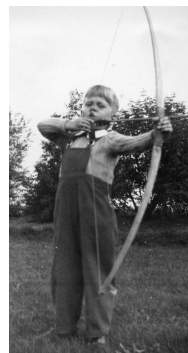
Samlet og redigeret af Holger Kürstein.