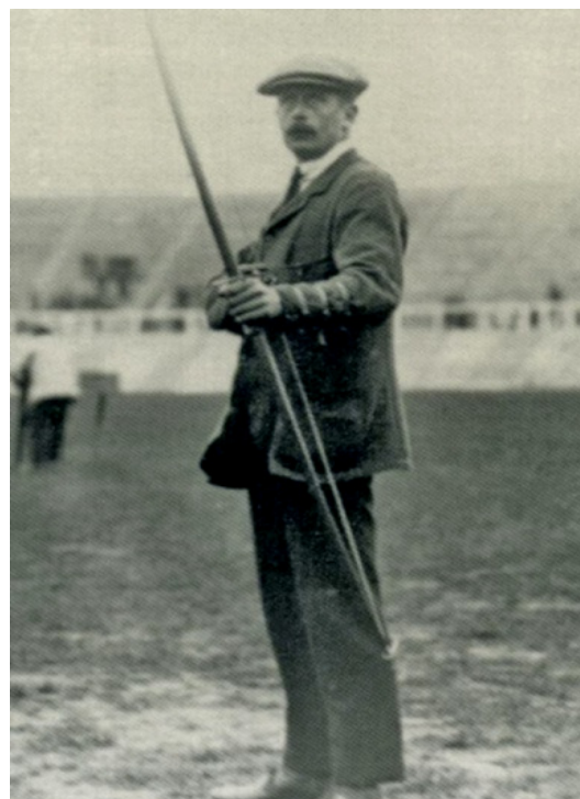
Også gemalen, William Dod, England, guldmedaljist, London 1908 i knapt så flot påklædning – dog med jakke og slips!

Krigsårene nedtonede FITA's momentum en hel del. Man havde indtil da afholdt ni verdensmesterskaber som havde indbefattet 12 nationer fra fire verdensdele.