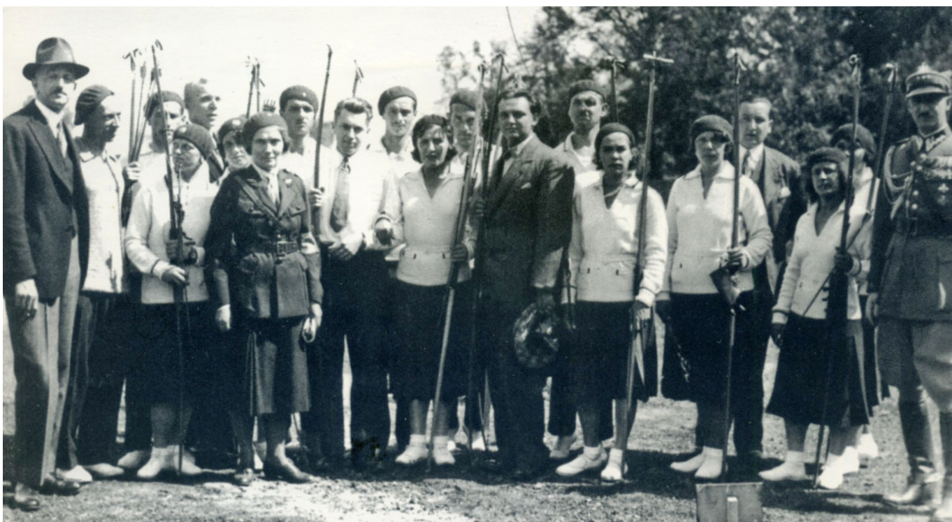
Bueskytter sammen med FITA's konstituerende forsamling ved VM i Polen 1931.