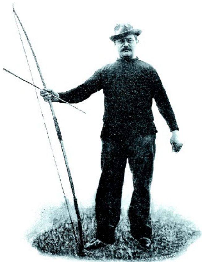
Belgiens Hubert van Innis fra Belgien med sin langbue, hvormed han allerede ved OL i Paris 1900 vandt sin første olympiske medalje, to guld- og en sølvmedalje, både organiserede bueskydningen og deltog i konkurrencerne i Antwerpen 1920 hvor han vandt fire guld- og to sølvmedaljer.

Hubert VAN Innis er den mest dekorerede bueskytte i olympisk historie. Han er også den belgiske atlet der vandt flest olympiske medaljer til i dag - i alt 10 medaljer, seks af guld og fire af sølv.