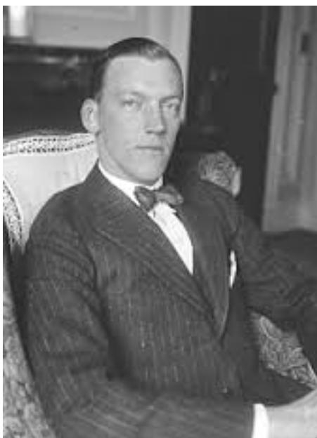
Inden for sportsverdenen var prins Axel især kendt som IOC's repræsentant i Danmark 1932–1958.

har været ført korrespondance angående forslag om, at en evt. finaleskydning - kun omfattende den korte runde - skulle kunne foregå på det olympiske stadion. Bemærkningen hertil fra Danmark var, at man tilsluttede sig et sådant forslag, men at det ikke skulle være afgørende. Samtidig anbefaler man, at den bane, hvor de nordiske mesterskaber 1951 i Helsingfors skulle afholdes, bliver godkendt som olympisk område. (Det nordiske mesterskab blev faktisk skudt på det olympiske stadion, som allerede var tilgængeligt året før). Og at de nødvendige medaljer stilles til rådighed, som så kunne overrækkes ved den sædvanlige ceremoni på det olympiske stadion.